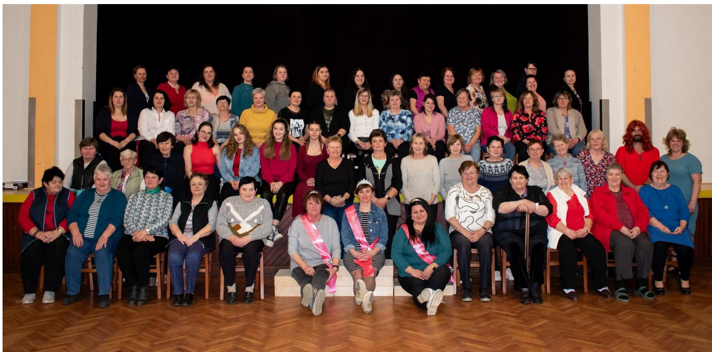
Sobota 8. 3. patřila všem ženám.