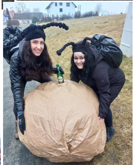
MASOPUSTNÍ PRŮVOD 2025